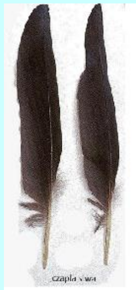
czapla v wra