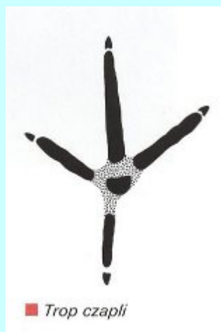
■ Trop czapli