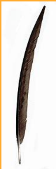
Zewnętrzna sierpowata lotka

Gorąco polecam lekturę tej strony wszystkim czytelnikom.