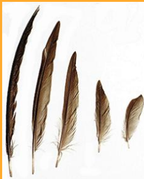
4 lotki I rzędu i 1 lotka II rzędu

Jerzyk gniazduje wysoko pod dachami wysokich budynków, strychach, w budkach szpaków, a czasem w dziuplach drzew. Okres lęgowy to maj i czerwiec. Gniazdo założone jest zwykle w szczelinach i wgłębieniach murów, pod odstającymi parapetami, na belkach lub pod dachówkami. W Jurze Krakowsko-Częstochowskiej w szczelinach skalnych (pierwotny, naturalny biotop). Wielkość i kształt gniazda zależą od wymiarów szczeliny, w jakiej się ono znajduje. Zazwyczaj ma ono kształt płaskiej czarki. Materiał